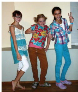
„Zeit für Mädchen“