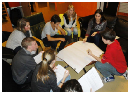
Workshop „dein Projekt gelingt“