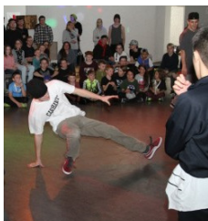
Clip zum „battle“ online