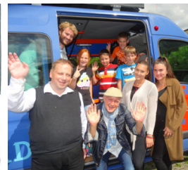
ida on air Radiocrew