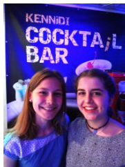
kenn i di?