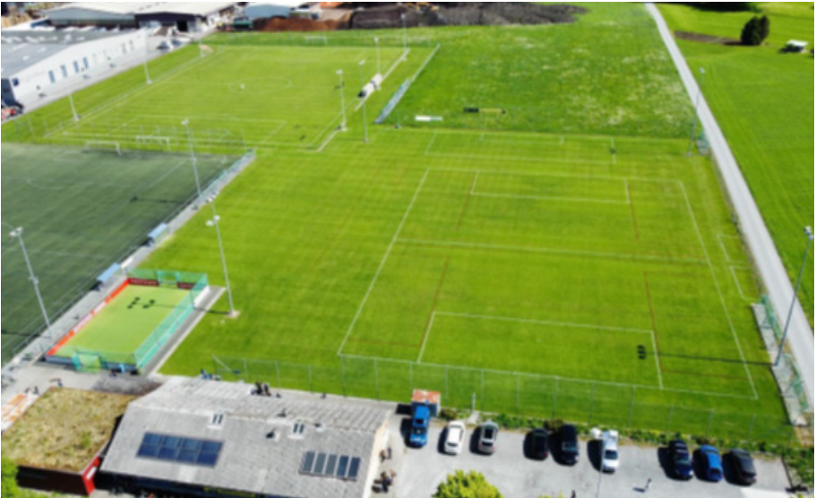
Abb.2: Heutige Sportanlage Grünthal, Luftaufnahme

Die oben genannten Gründe zeigen, dass eine Konzentration des FC Altstätten auf eine Anlage notwendig und sinnvoll ist. Im folgenden Kapitel wird das geplante Sanierungs- und Erweiterungsprojekt erläutert.