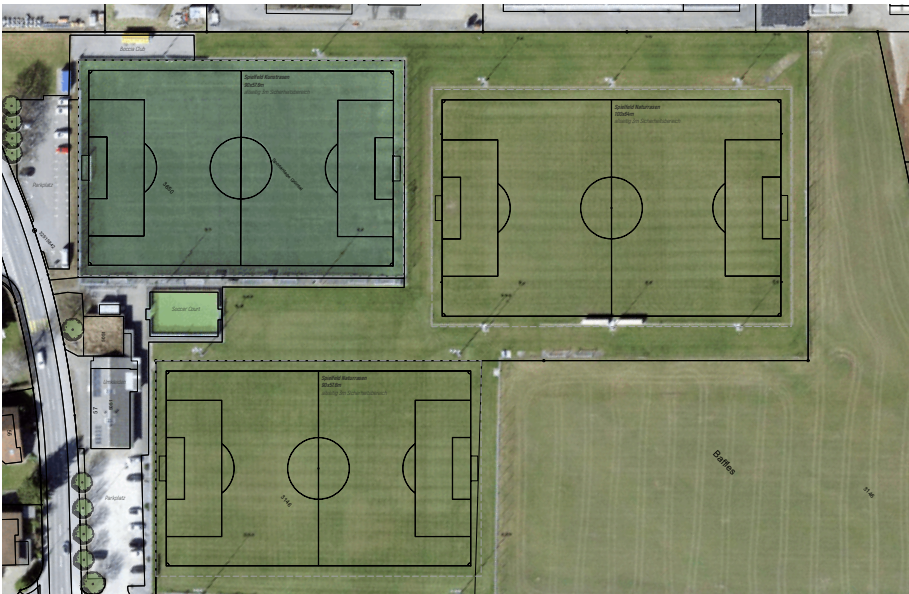
Abb. 1: Heutige Sportanlage Grüntal, Situationsplan

Der Gastronomiebereich der Sportanlage Grüntal ist relativ klein und verfügt über keine fest installierte Kücheninfrastruktur. Auch die beiden Garderobengebäude weisen ein fortgeschrittenes Alter auf und entsprechen nicht mehr den heutigen Anforderungen. Zudem besteht ein klarer Bedarf an weiteren Sanitär- und WC-Anlagen.