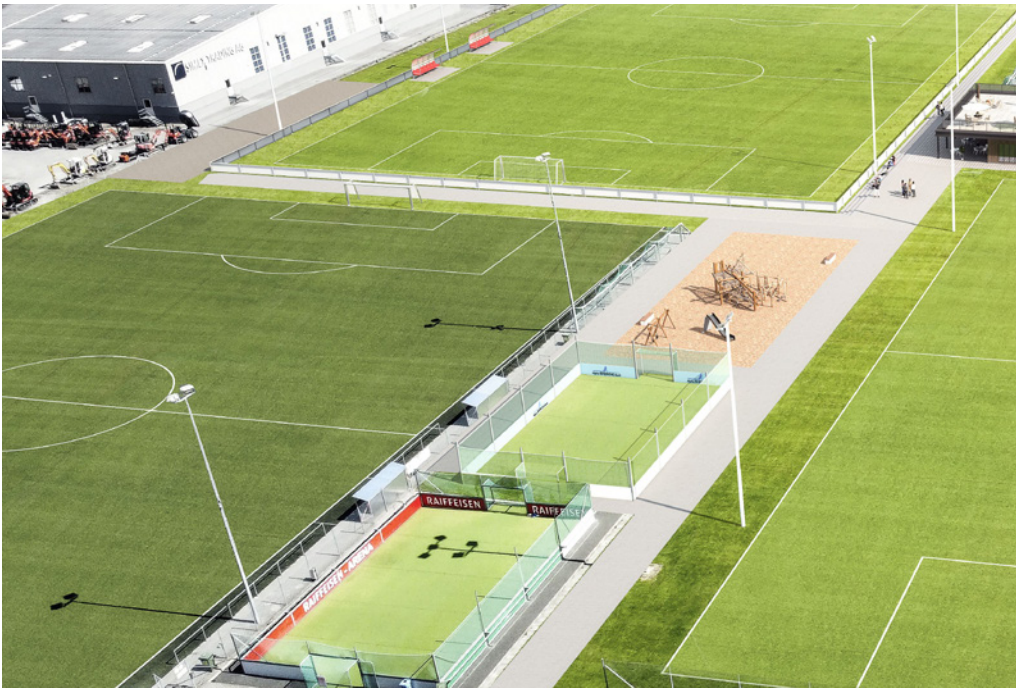
Abb. 5: Projekt Sportanlage Grünthal, Visualisierung

Durch den zweiten Kunstrasenplatz kann insbesondere im Winter vermehrt auf der Anlage trainiert werden; nur noch die jüngsten Junior*innenteams sollen im Winter in der Halle trainieren. Dies führt zu einer Entlastung der Turnhallenbelegung, sodass auch die Turnhallen vermehrt durch andere Vereine genutzt werden können.