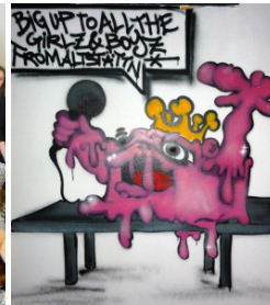
Sprayaktion im Treff